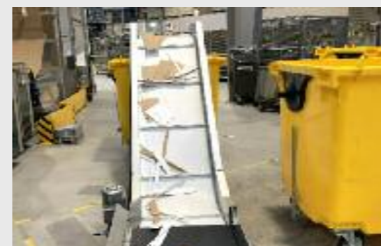
Nonstop Produktion ohne Containerwechsel