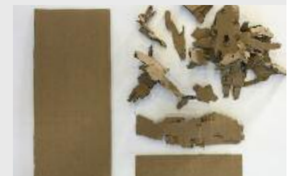
20-30% mehr Füllungsgrad der Container